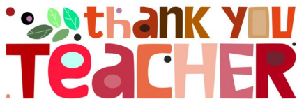
HONNEUR à L'ENSEIGNANT